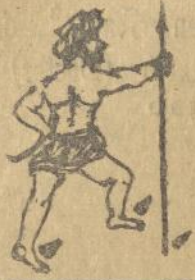
Melo Appandjoenggal gabe koporol.

Ndang aong na so oelaon ni App. gotapon ni moesoe djala sai soede do i dthamalahon dietong rohana Taanto ma olfik djoenggal ni App ndang taroromsa i agia toe sepma djala sai ibana do di etong oemmalu sian sepma i.