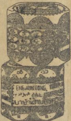
Dalem goetji ketjil merah dan poeti

Obat tjap Matjan tida boleh tida ada di toean poenja roemah, kerna tida ada obat lebih baek boeat semboehken Rheumatiek, sakit boekoe toelang dan spier, kasaleo dan pilek dari pada ini obat oemoem. Djoega boeat laen-laen penjakit dan ganggoean obat tjap Matjan ada mandjoer. Tjoba soeroe toean poenja boedjang beli boeat satalen satoe goetji ketjil Obat Matjan. Toean pasti aken dapet kafaedahan dari ini.